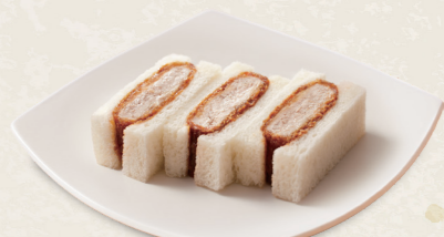
ヒレかつサンド [3切] 450円(税込495円) [6切] 885円(税込973円)