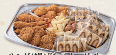
サンド/揚げものオードブル 一口ヒレかつ・海老フライ・クリームコロッケ ウインナー・ハーフサンド・フレンチポテト 6,200円(税込6,820円)～