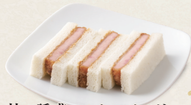
甘い誘惑ハムかつサンド [3切] 460円(税込506円)