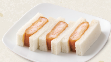
エビかつサンド [3切] 490円(税込539円)