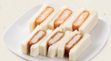
ミックスサンド(ヒレ・エビ) [各3切] 925円(税込1,017円)