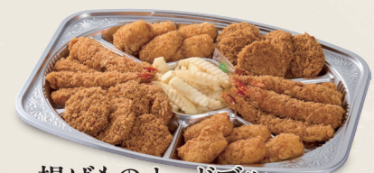
揚げものオードブル 一口ヒレかつ・海老フライ・クリームコロッケ フレンチポテト 5,050円(税込5,555円)～