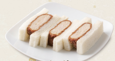
メンチかつサンド [3切] 400円(税込440円)